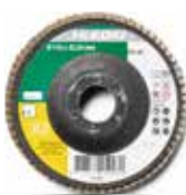
Fächerscheibe Ø115 mm, 10 Stk 4100111