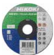
Trennscheibe Ø115 mm, 25 Stk 752511

Erweitern Sie Ihren Winkelschleifer mit Zubehör, wie z. B. verschiedenen Scheiben oder Bürsten oder einem Staubfilter. Der feinmaschige Filter erhöht die Staubresistenz drastisch.