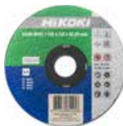
Trennscheibe Ø125 mm, 25 Stk 752512