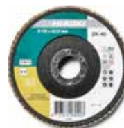
Fächerscheibe Ø125 mm, 10 Stk 4100116