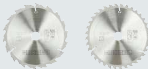
TCT-Sägeblatt für Holz Ø165 mm T18 752414 TCT-Sägeblatt für Holz Ø165 mm T36 752415